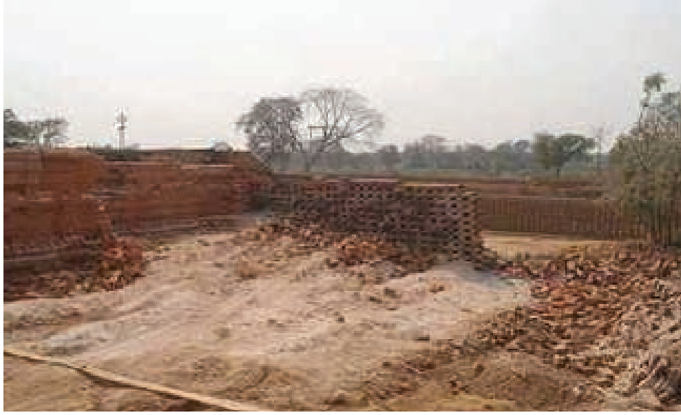
कारोबार अधिकारियों के सह पर चल रहा है।

नगर के आसपास के क्षेत्रों में इन दिनों ईटा भट्टा सारे नियम कानूनों को दर किनार खुलेआम संचालित है। जहां पर हजारों लाखों ईट तो बनाये जा रहे हैं, लेकिन ईट पकाने का काम चोरी के कोयले से किये जा रहा है। न तो खनिज विभाग इस ओर ध्यान दे रहा है न ही स्थानीय प्रशासन। शहडोल नगर की बात की जाये तो देखा जा सकता है कि दर्जनों ईट के भट्टे संचालित है जहां पर चोरी के कोयले से ईट पकाने का काम किया जाता है। संभागीय मुख्यालय से सटे गांव पचगांव, कुदरी, चांपा, जमुई, छतवाई के आसपास ही दर्जन भर ईट भट्टे संचालित है। यहां पर नियमों को दर किनार करके भट्टों का संचालन किया जा रहा है यहा पर नवालिंग बच्चों को भी काम करते देखा जा सकता है। विभिन्न ग्रामों में दर्जनों भट्टे संचालित है और यहां पर ईट पकाने के लिये जिन कोयले का इस्तेमाल किया जा रहा है।