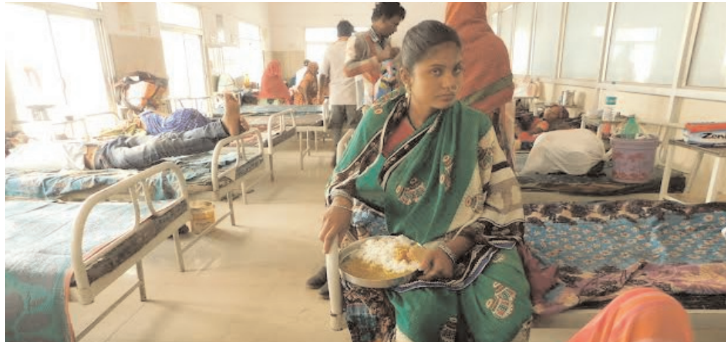
विजय मत, शहडोल।

गर्मी का मौसम शुरू हो गया है। लोगों को धूप झुलसा रही है, तो पारा 35 से 40 डिग्री के करीब है। इसके चलते आमजन परेशान हैं तो बीमार की क्या स्थिति होगी, सहज अंदाजा लगाया जा सकता है। उस पर शहडोल जिले के विभिन्न अस्पतालों में पंखे नहीं तो यहाँ गर्मी के कारण भर्ती मरीज हलकान तो परिजन परेशान नजर आ रहे हैं। ऐसे में खान-पान में थोड़ी सी लापरवाही से लोग अस्पताल पहुंच रहे हैं। जिला अस्पताल में दो दिनों में उल्टी-दस्त, लू और डायरिया के अधिक मरीज पहुंच चुके हैं। इनमें से कुछ अस्पताल में भर्ती भी हैं। जिला अस्पताल के मेडिकल वार्ड, सर्जिकल वार्ड, आर्थो वार्ड सहित शिशु वार्ड मरीजों से भर गए हैं। लेकिन अस्पताल में अभी कूलर व एग्जास्ट फैन शुरू नहीं हुए हैं। जिससे वार्ड में उमस के कारण मरीज