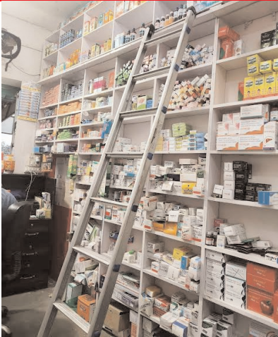
नहीं ले रहे हैं। शहर में नशीली दवाओं का कारोबार बढ़ रहा है।

दवा से जरूरी कुछ नहीं होता। इसकी उपयोगिता एक जरूरतमंद से बेहतर भला और कौन समझ सकता है। जिले में अधिकांश खुदरा दवा विक्रेता अपने ग्राहकों को रसीद तक नहीं देते सादे पर्चों में टोटल लिखकर रसीद के रूप में दे देते हैं और सच बात यह भी है कि ग्राहक खुद रसीद के चक्र में नहीं पड़ता। उसने दवा की पर्ची दी, दुकानदार ने दवा दी और सादे कागज पर टोटल करके अमाउंट बताकर रुपये लेकर दूसरे ग्राहक की पर्ची पर ध्यान केंद्रित कर देता है। हकीकत यह भी कि कोई ग्राहक दुकान वाले से न तो उसकी डिग्री पूछता है न ही लायसेंस की जानकारी लेता है। दरअसल जिन अधिकारियों को सरकार ने जांच पड़ताल करने की पगार देती है वो भी नजराने की कीमत पर अनदेखी कर देते हैं। यही वजह है कि अधिकांश दवा दुकानें बेतरतीब होती जा रही हैं। ऐसा लगता है जैसे इनके ऊपर किसी तरह का नियम लागू नहीं होता।