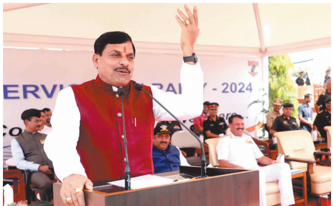
वीरता और शौर्य का परिचय देकर भारतीय लोकतंत्र की रक्षा की है। भारत के साथ और भी देश आजाद हुए थे। लेकिन वर्तमान समय में विश्व का सबसे बड़ा लोकतंत्र जड़ित जा रहा है तो यह भारतीय सेना के कारण ही संभव हुआ है। सेना ने देश की सीमाओं की रक्षा कर लोकतंत्र को जीवित रखा है। मुख्यमंत्री डॉ. यादव ने भारतीय सेना के भूतपूर्व सैनिकों के अविस्मरणीय योगदान के लिए प्रदेश की जनता की ओर से अभिनंदन किया।

मुख्यमंत्री डॉ. मोहन यादव ने कहा कि प्रधानमंत्री नरेंद्र मोदी के नेतृत्व में भारतीय सेना का मनोबल बढ़ा है। सेना को नवीन तकनीक के नवीनतम हथियार उपलब्ध कराए जा रहे हैं। प्रधानमंत्री मोदी ने विदेशी हथियारों पर भारतीय सेना की निर्भरता कम करते हुए स्वदेशी लड़ाकू विमान और हथियार निर्माण पर विशेष ध्यान दिया है। अब हम सिर्फ युद्ध का जवाब ही नहीं देते बल्कि घर में घुसकर मारते हैं। मुख्यमंत्री डॉ. यादव 3 ईएमई सेंटर भोपाल में भूतपूर्व सैनिक सम्मान कार्यक्रम को संबोधित कर रहे थे। मुख्यमंत्री डॉ. यादव ने कहा कि भूतपूर्व सैनिकों की देश भक्ति और समर्पण में वर्तमान सेना की नींव रखी है। जब भी मौका पड़ा आप सभी ने