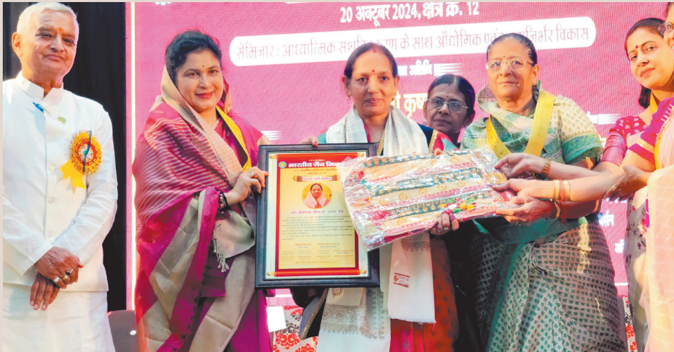
हृदय से बधाई देती हूँ, जिन्होंने आज करवा चौथ के पावन अवसर पर यह कार्यक्रम किया। उन्होंने और असीम समर्पण के पावन पर्व करवा चौथ की शुभकामनाएं दी