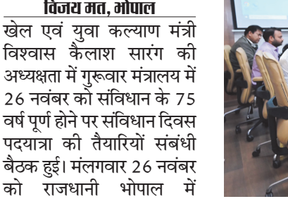
आवश्यक निर्देश दिये। यात्रा खेल एवं युवा कल्याण विभाग के समन्वय में होगी। इसमें नेहरू युवा केन्द्र, राष्ट्रीय सेवा योजना, उच्च शिक्षा, स्कूल शिक्षा, चिकित्सा शिक्षा, तकनीकी शिक्षा के युवा शामिल होंगे। पद-यात्रा में खेल एवं युवा कल्याण के खिलाड़ी और आदिम जाति कल्याण विभाग के संबंधित छात्रावासों के विद्यार्थी भी सम्मिलित होंगे।

खेल एवं युवा कल्याण मंत्री विश्वास कैलाश सारंग की अध्यक्षता में गुरुवार मंत्रालय में 26 नवंबर को संविधान के 75 वर्ष पूर्ण होने पर संविधान दिवस पद-यात्रा की तैयारियों संबंधी बैठक हुई। मंगलवार 26 नवंबर को राजधानी गोपाल में संविधान दिवस पद-यात्रा का आयोजन किया जा रहा है। इसमें 2000 से अधिक युवाओं के शामिल होने की उम्मीद है। मंत्री सारंग ने बताया कि संविधान दिवस पद-यात्रा शौर्य स्मारक से शुरू होकर बोर्ड ऑफिस चौराहा स्थित संविधान निर्माता डॉ. बी.आर. अम्बेडकर की प्रतिमा को नमन कर शौर्य स्मारक पर समापन होगा। उन्होंने पद-यात्रा के आयोजन के संबंध में जिला प्रशासन और पुलिस प्रशासन के अधिकारियों को आवश्यक निर्देश दिये। यात्रा खेल एवं युवा कल्याण विभाग के समन्वय में होगी। इसमें नेहरू युवा केन्द्र, राष्ट्रीय सेवा योजना, उच्च शिक्षा, स्कूल शिक्षा, चिकित्सा शिक्षा, तकनीकी शिक्षा के युवा शामिल होंगे। पद-यात्रा में खेल एवं युवा कल्याण के खिलाड़ी और आदिम जाति कल्याण विभाग के संबंधित छात्रावासों के विद्यार्थी भी सम्मिलित होंगे। मंत्री सारंग ने बताया कि संविधान दिवस पद-यात्रा