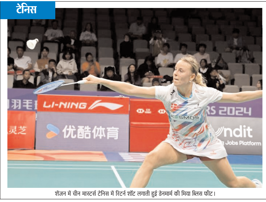
शंजोन में चीन मास्टर्स टेनिस में रिटर्न शॉट लगाती हुई डेनमार्क की मिया ब्लिस फीट।