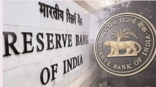
आर्थिक बुनियाद की स्वाभाविक ताकत खुद को सुदृढ़ कर रही है।

नई दिल्ली, एजेंसी भारतीय अर्थव्यवस्था में दूसरी तिमाही में देखी जा रही आर्थिक सुस्ती की बारीकीयों पर रोशनी डालने के लिए भारतीय रिजर्व बैंक (आरबीआई) ने बुलेटिन में सूचना दी है। नवंबर माह का बुलेटिन प्रकाशित होने के साथ आरबीआई ने बताया कि निजी खपत में वृद्धि के कारण अर्थव्यवस्था में मजबूती दिखाई दे रही है। जानकारों के मुताबिक मध्यम अवधि का दृष्टिकोण तेजी का बना हुआ है क्योंकि वृहद आर्थिक बुनियाद की स्वाभाविक ताकत खुद को सुदृढ़ कर रही है। इस बुलेटिन में उच्चाधिकारियों ने भारत की रोजगार सृजन क्षमता की मजबूत होने की भविष्यवाणी की है। आरबीआई द्वारा जारी बयान के अनुसार निजी निवेश कमजोर हो रहे हैं, हालांकि खरीफ और रबी फसलों में उत्तम उत्पादन के साथ कृषि क्षेत्र में उत्थान के संकेत हैं। व्यापारिक सेवा क्षेत्र में भी गतिशीलता बरकरार है और ईवी वाहनों के संचालन पर ध्यान दिया जा रहा है। इसके अतिरिक्त, वित्तीय बाजारों में अनिश्चितता के बावजूद, आरबीआई उम्मीद जताता है कि विश्वसनीय स्थितियों का अनुमान लगाना संभव है। नए स्वच्छ ऊर्जा क्षेत्र में रोजगार के समृद्ध स्वरूप ने भी आर्थिक महसूस को चिंताजनक अवस्था से बाहर निकाला है। अधिकारियों का कहना है कि यह लेख उनके स्वयं के विचार हैं, और केंद्रीय बैंक का कोई संबंध नहीं है। गुरुवार को बाजारों की गतिविधियों का ध्यान खिंचने के लिए भविष्य का अनुमान गंभीरता से किया जा रहा है। इस अहम कुशलक्षेत्र में भारत के आर्थिक स्थिति की मजबूत दरारों में से एक है, जो आगे बढ़ने के लिए उत्तेजित करती है।