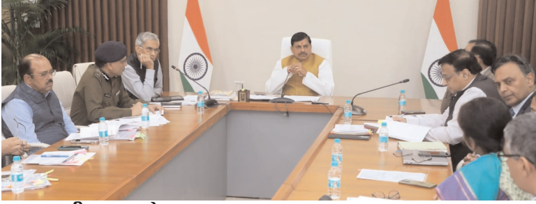
विजय मत, भोपाल

मुख्यमंत्री डॉ. मोहन यादव ने कहा है कि प्रदेश के सभी जिलों में चाहे विकास का प्रश्न हो, शासन की प्राथमिकताओं के अनुसार कार्यों का क्रियान्वयन या कानून-व्यवस्था की बात हो, आदर्श स्थिति बनाए रखने का दायित्व कलेक्टर-एसपी का है। अपने जिले में सभी व्यवस्थाओं के लिए कलेक्टर और एसपी जिम्मेदार होंगे। जिन जिलों से अनियमितताओं की शिकायतें आएं, वहां बड़े अधिकारियों को भी नहीं बख्शा जाएगा। मुख्यमंत्री डॉ. यादव ने कहा कि प्रदेश में 22 हजार थानों की सीमाओं में आवश्यक परिवर्तन हुए हैं। जन-कल्याण की दृष्टि से जिलों के पुनर्गठन के लिए राज्य शासन ने आयोग गठित किया है। इसमें कलेक्टर और जन-प्रतिनिधि भी जरूरी सुझाव देकर सहयोग करें। आने वाले समय में महिलाओं को एक तिहाई आरक्षण, आबादी के अनुपात में प्रतिनिधित्व देने जैसे निर्णय क्रियान्वित होंगे।