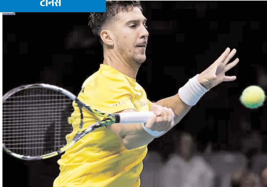
मलागा में डेविस कप टेनिस क्वार्टर फाइनल में खेलते हुए ऑस्ट्रेलिया के थानस कोकिनाकिरा।