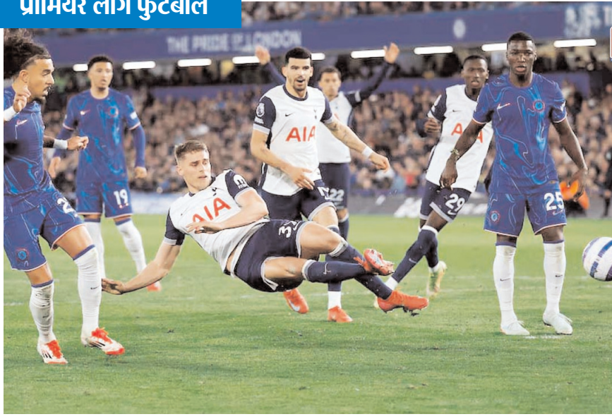
लंदन में प्रीमियर लीग फुटबॉल में चेल्सेा और टोटनहैम के बीच हुए मुकाबले में भाग लेते हुए खिलाड़ी।