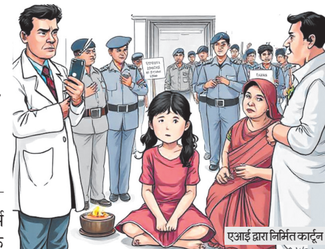
एआई द्वारा निर्मित कार्टून