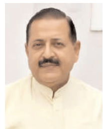
डॉ. जितेंद्र सिंह केंद्रीय राज्य मंत्री

कल्पना करें कि राजस्थान के दूरदराज के किसी कोने में जिला कलेक्टर को एक ऐसी महत्वाकांक्षी कल्याण योजना की जिम्मेदारी सौंपी जाती है जिसके बारे में उसकी जानकारी बहुत कम है। एक दशक पहले उसे जानकारी के लिए कहीं धूल खा रही किसी नियमावली का सहारा लेना होता। या फिर वह अपने किसी विरिष्ठ सहयोगी की तीन बैठकों और लंबे के बाद खाली होने का इंतजार करता। उसकी उम्मीद उस प्रशिक्षण कार्यक्रम पर भी टिकी हो सकती थी जो शायद एक या दो साल में कभी आता। लेकिन आज वह अपने फोन के जरिए आईगॉट (इंटीग्रेटेड गवर्नमेंट ऑनलाइन ट्रेनिंग प्लेटफॉर्म) पर लॉग ऑन करता है। उसे मिनटों में ही अपनी जरूरत के अनुरूप एक सुव्यवस्थित कार्यक्रम शालता आधारित पाठ्यक्रम मिल जाता है। वह शाम तक सूचनाओं और आत्मविश्वास से लैस होकर योजना के लाभार्थियों की पहली बैठक की अध्यक्षता कर रहा होता है। यह बदलाव देखने में छोटा लग सकता है मगर हकीकत में किसी क्रांति से कम नहीं है।