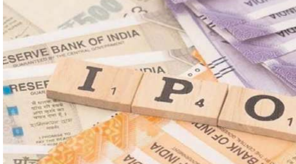
नई दिल्ली, एजेंसी

सेकेंडरी बाजार में गिरावट और वैश्विक अनिश्चितताओं के बावजूद भारत का प्राथमिक बाजार वित्त वर्ष 2026 में नई ऊंचाइयों पर पहुंच गया। आईपीओ के जरिए