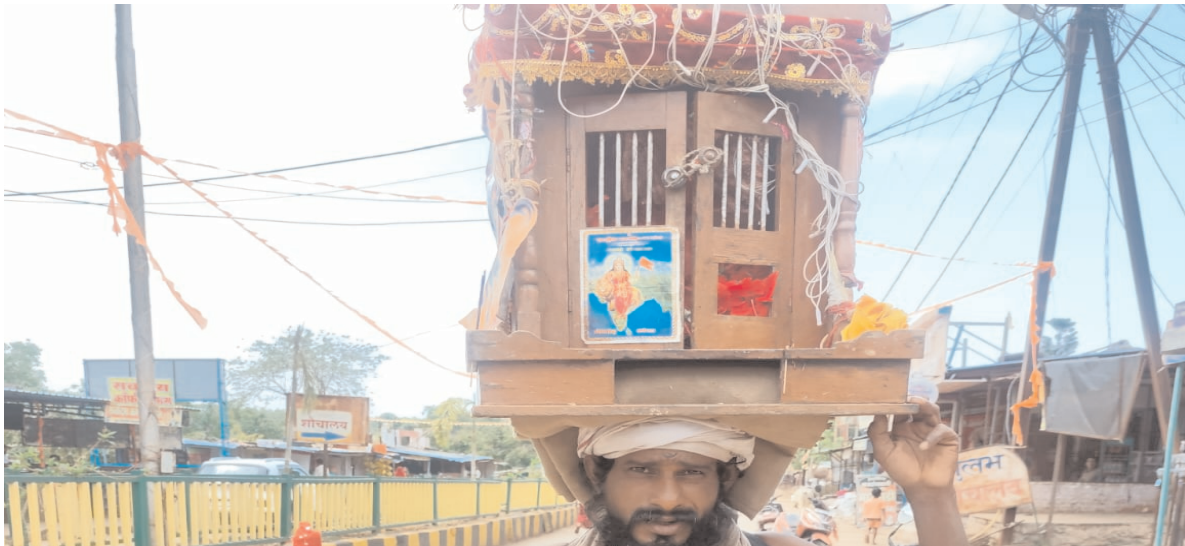
विजय मत, शहडोल

शहर के बीचों-बीच स्थित पौनाग तालाब, जिसे कभी शहर के सौंदर्य और पर्यावरण संरक्षण की बड़ी परियोजना के रूप में विकसित करने की योजना बनाई गई थी, आज भी उषेष्णा का शिकार बना हुआ है। हाल ही में नगर पालिका द्वारा प्रस्तुत बजट में इस तालाब का नाम तक शामिल नहीं किया गया, जिससे वर्षों से चल रही योजनाओं और दावों पर गंभीर सवाल खड़े हो गए हैं। नगर के बाईपास रोड स्थित पौनाग तालाब और इसके आसपास के अन्य जलस्रोतों के संरक्षण और सौंदर्याकरण को लेकर वर्ष 2016 से पहले से ही योजनाएं बनाई जा रही हैं, लेकिन आज तक यह परियोजना धरातल पर पूरी नहीं उतर सकी है। हर बार नई योजना, नए प्रस्ताव और नई उम्मीदों के साथ शुरुआत होती है, लेकिन कुछ समय बाद मामला फिर उठे बस्ते में चला जाता है।