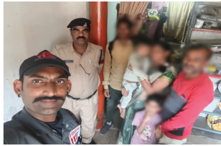
विजय मत, शहडोल

शहडोल जिले के थाना कोतवाली क्षेत्र में डायल-112 जवानों की तत्पर और संवेदनशील कार्यवाही से खेलते-खेलते घर