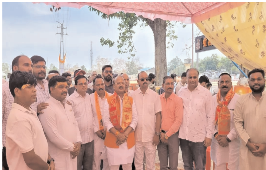
हनुमान जयंती के अवसर पर बिजुरी में आयोजित कार्यक्रम में भाजपा मंडल के सदस्यों और श्रद्धालुओं का संगम।