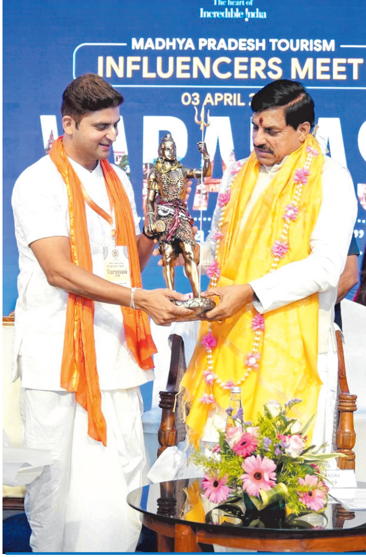
विजय मत, भोपाल

काशी की पानव धरती पर तीन दिवसीय 'सम्राट विक्रमादित्य' महानाट्य का भव्य शुभारंभ हुआ, जिसमें मध्यप्रदेश के मुख्यमंत्री डॉ. मोहन यादव और उत्तरप्रदेश के मुख्यमंत्री योगी आदित्यनाथ ने संयुक्त रूप से दीप प्रज्वलित कर कार्यक्रम का उद्घाटन किया। इस अवसर पर मुख्यमंत्री डॉ. यादव ने कहा कि सम्राट विक्रमादित्य सुशासन, न्यायप्रियता और राष्ट्र गौरव के प्रतीक रहे हैं और आज प्रधानमंत्री नरेंद्र मोदी के नेतृत्व में देश में उसी सुशासन की अनुभूति स्वाभाविक रूप से होती है। उन्होंने कहा कि काशी, जो प्रधानमंत्री की कर्मस्थली है, वहां इस महानाट्य का मंचन विशेष महत्व रखता है। यह आयोजन केवल सांस्कृतिक प्रस्तुति नहीं, बल्कि भारत की गौरवशाली परंपरा को जीवंत करने का प्रयास है। मुख्यमंत्री ने कहा कि मध्यप्रदेश और उत्तरप्रदेश के बीच यह कार्यक्रम सांस्कृतिक संबंधों को और मजबूत करेगा तथा दोनों राज्यों के बीच सहयोग को नई दिशा देगा। मुख्यमंत्री ने केन-बेतवा नदी जोड़ने परियोजना का उल्लेख करते हुए कहा कि यह प्रधानमंत्री के सुशासन का उदाहरण है, जो राज्यों के बीच समन्वय और विकास को बढ़ावा देता है। उन्होंने कहा कि सम्राट विक्रमादित्य के आदर्श-न्याय, पराक्रम और प्रजा-हित-आज भी प्रासंगिक हैं और युवा पीढ़ी को उनसे प्रेरणा लेने की आवश्यकता है। उन्होंने बताया कि महानाट्य के