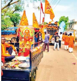
दक्षिण मुखी होने की वजह से बढ़ जाती है मंदिर की विशिष्टता आग्र बगीचा में मुख्य मार्ग से लगा हुआ है प्राचीन श्री सिद्धपीठ दक्षिणमुखी हनुमान मंदिर लोगों की आस्था