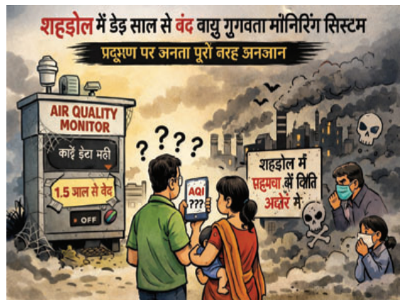
बनेगी? यह स्थिति प्रशासनिक लापरवाही के साथ-साथ पारदर्शिता की कमी को भी दर्शाती है।

जिले एक ओर सरकार पर्यावरण संरक्षण और प्रदूषण नियंत्रण को लेकर बड़े-बड़े दावे कर रही है, वहीं दूसरी ओर शहडोल संभागीय मुख्यालय में वायु गुणवत्ता की वास्तविक स्थिति जानने वाला पूरा सिस्टम ही 'खामोश' पड़ा है। पिछले डेढ़ साल से अधिक समय से यहां एयर क्वालिटी मॉनिटरिंग सिस्टम बंद है, जिसके कारण शहर के लोग यह तक नहीं जान पा रहे कि वे किस हवा में सांस ले रहे हैं, वह सुरक्षित है या खतरनाक। स्थिति और भी चिंताजनक तब हो जाती है जब यह सामने आता है कि सार्वजनिक सूचना के लिए लगाए गए एयर क्वालिटी इंडेक्स बोर्ड पर 21 सितंबर 2024 के बाद से कोई अपडेट ही नहीं किया गया है। यानी करीब डेढ़ साल से अधिक समय से प्रदूषण का कोई आधिकारिक आंकड़ा उपलब्ध नहीं है। यह न केवल तकनीकी लापरवाही को दर्शाता है, बल्कि आम नागरिकों के स्वास्थ्य के प्रति जिम्मेदार एजेंसियों की उदासीनता को भी उजागर करता है।