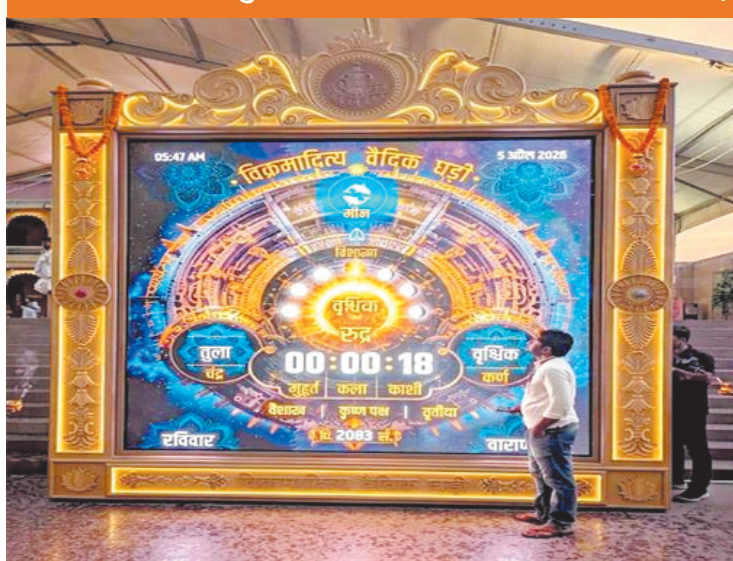
विजय मत, भोपाल। कालगणना की पावन नगरी और 'महाकाल' के केंद्र उज्जैन से निकली भारतीय संस्कृति की गौरवशाली परंपरा अब बाबा विश्वनाथ की नगरी काशी में भी जीवंत हो उठी है। मुख्यमंत्री डॉ. मोहन यादव की विशेष पहल पर, भारतीय कालगणना पर आधारित विश्व की प्रथम 'विक्रमादित्य वैदिक घड़ी' को उत्तर प्रदेश के वाराणसी स्थित काशी विश्वनाथ मंदिर प्रांगण में सफलतापूर्वक स्थापित कर दिया गया है। मुख्यमंत्री डॉ. मोहन यादव ने 3 अप्रैल को उत्तर प्रदेश के मुख्यमंत्री योगी आदित्यनाथ को बाबा काशी विश्वनाथ को अर्पित यह घड़ी भेंट की थी।