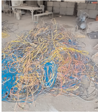
कहीं ना कहीं उसमें पूर्ण रूप से सफलता मिलती ही नजर नहीं आई कुछ समय पहले अवैध कनेक्शन के खिलाफ एक बड़ी मुहिम चलाई गई थी एक बार फिर से अवैध कनेक्शन धारियों की भरमार देखने को मिलने लगी है जिन लोगों के कनेक्शन काटे गए थे वह फिर से जोड़ते हुए देखे जा सकते हैं और प्रबंधन जिस सोच के साथ इस कार्यवाही को आगे बढ़ाया था

विगत कुछ दिनों पहले सोहागपुर एरिया प्रबंधन के द्वारा एक टीम का गठन किया गया था जोकि अवैध कनेक्शन धारियों के खिलाफ लगातार कार्यवाही कर रही थी इस कार्यवाही का परिणाम भी अच्छा देखने को मिल रहा था और लोगों में हड़कंप भी मचा था बड़ी संख्या में न सिर्फ अवैध कनेक्शन काटे गए थे बल्कि तारों को भी जप्त किया गया था इन अवैध कनेक्शन के चलते प्रबंधन को हर माह लाखों रुपए का नुकसान उठाना पड़ा था जिसे देखते हुए ही इस पर कार्यवाही शुरू की गई थी लेकिन कार्यवाही के कुछ दिनों के बाद एक बार फिर से अवैध कनेक्शन धारियों की भरमार देखने को मिलने लगी है जिन लोगों के कनेक्शन काटे गए थे वह फिर से जोड़ते हुए देखे जा सकते हैं और प्रबंधन जिस सोच के साथ इस कार्यवाही को आगे बढ़ाया था