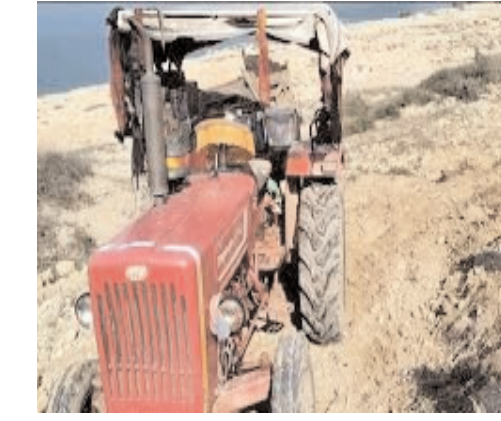
विजय मत, शहडोल

विजय मत, शहडोल शहडोल नगर की सड़कों पर इन दिनों हालात बेहद चिंताजनक होते जा रहे हैं। रेत से भरे ओवरलोड ट्रक और ड्रिग्यां बेखोफ होकर तेज रफतार में शहर के भीतर प्रवेश कर रही हैं। यातायात नियमों की खुलेआम अनदेखी हो रही है, लेकिन जिम्मेदार विभागों की ओर से कोई ठोस कार्रवाई नजर नहीं आ रही। प्रशासन की यह चुपपी अब लोगों के लिए भारी पड़ती दिखाई दे रही है। बुढ़ार चौराहा, गांधी चौराहा, अंबेडकर चौराहा और लड्डू सिंह चौराहा जैसे व्यस्त इलाकों में भारी वाहनों का दबाव लगातार बढ़ता जा रहा है। इन चौराहों पर जहां सख्त निगरानी की जरूरत है, वहां यातायात पुलिस की मौजूदगी बेहद कम दिखाई देती है। नतीजा यह है कि ट्रक चालक बिना किसी डर के नियमों की धज्जियां उड़ाते हुए गुजरते हैं। रेत से लदे ये वाहन न केवल क्षमता से अधिक भार लेकर चलते हैं, बल्कि तेज रफतार में भी दौड़ते हैं। कई बार इनसे गिरती रेत सड़क पर