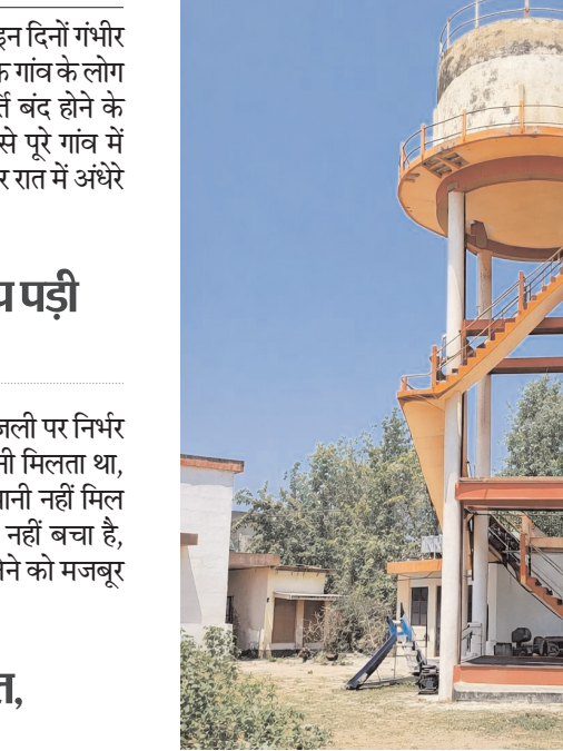
विजय मत, शहडोल

जैसे-जैसे गर्मी का असर बढ़ रहा है, पानी की जरूरत भी बढ़ती जा रही है। ऐसे में नल-जल योजना के बंद होने से हालात और गंभीर हो गए हैं। सीमित जल स्रोतों पर बढ़ते दबाव ने समस्या को और गहरा कर दिया है, जिससे ग्रामीणों की परेशानी लगातार बढ़ती जा रही है।