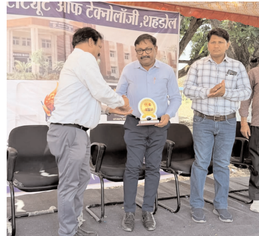
विजय मत, शहडोल

यूआईटी-आरजीपीवी, शहडोल में यूआईटी-उत्सव 2026 का भव्य शुभारंभ किया गया। इस अवसर पर संस्थान में खेल एवं सांस्कृतिक गतिविधियों का आयोजन प्रारंभ हुआ, जिसमें छात्रों में खासा उत्साह देखने को मिला। कार्यक्रम में मुख्य अतिथि के रूप में जीएमओ सोहनपुर एरिया