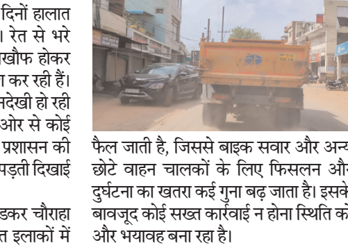
विजय मत, शहडोल

फैल जाती है, जिससे बाइक सवार और अन्य छोटे वाहन चालकों के लिए फिसलन और दुर्घटना का खतरा कई गुना बढ़ जाता है। इसके बावजूद कोई सख्त कार्रवाई न होना स्थिति को और भयावह बना रहा है। नागरिकों में गुस्सा, हर दिन जोखिम में जान शहर के लोगों में इस मुद्दे को लेकर गहरा आक्रोश है। नागरिकों का कहना है कि वे रोजाना अपनी जान जोखिम में डालकर घर से बाहर निकलते हैं। बच्चों, बुजुर्गों और