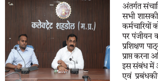
विजय मत, शहडोल